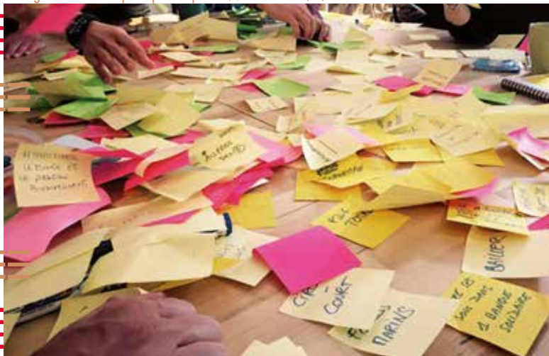
2- Programmation, conception, réalisation : phase de réflexion, concertation citoyenne