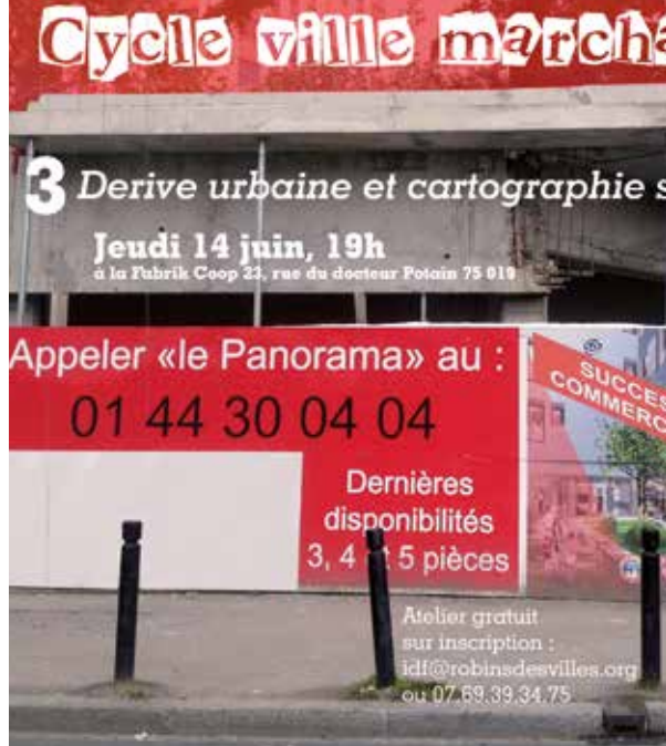
Balade urbaine, Les Robins des Villes, Montreuil (93)

Démocratiser la décision et encourager la participation citoyenne, éduquer, sensibiliser.