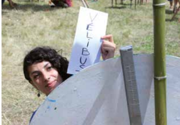
De retour en Ardèche, Les Robins des Villes, Pont d'Aubenas (07)

Cette intervention s'est faite dans le cadre d'une fête de quartier et en lien avec l'association pôle énergie.