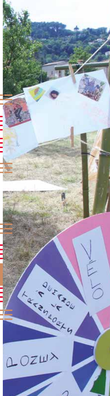
Inauguration de la route nationale 470, artgeneering, Pay