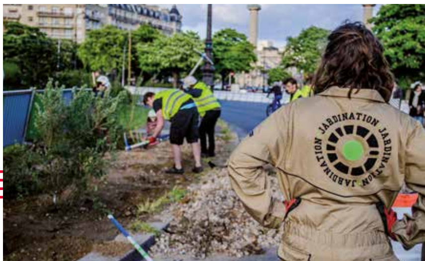
Réinventons la Nation, renouvellement urbain, Coloco, Paris (75)

C'est l'outil le plus plébiscité. Accessible à tous, il permet d'appréhender tous les contextes géographiques à des échelles différentes. Cet outil de travail se construit grâce à l'ensemble des participants et est le résultat d'une réflexion collective. Il faut souligner le fait que la maquette ne doit en aucun cas