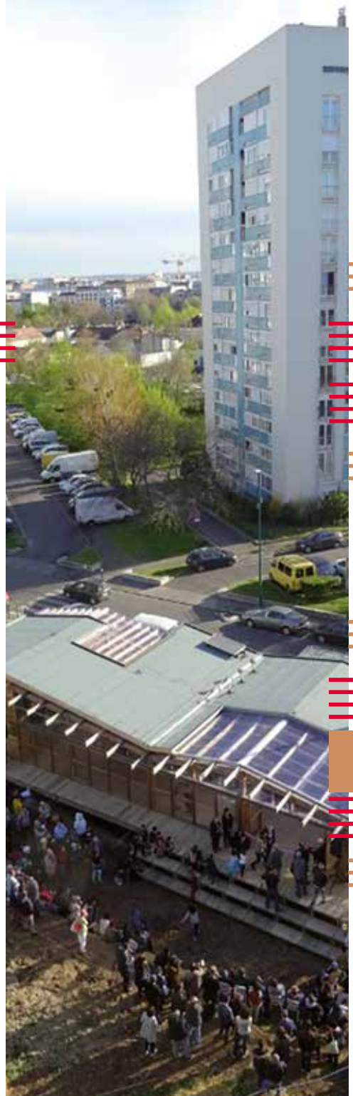
Inauguration de l'agrocité, projet R-urban Atelier d'Architecture Autogéré, Gennevilliers (92)

Le projet Agrocité a été conçu pour permettre l'initiation et le soutien des démarches d'agriculture urbaine mais aussi pour accompagner les projets culturels mis en place par le projet R-urban. Agrocité se décompose en trois zones : une zone dédiée aux activités liées à la nature et à l'agriculture, une zone dédiée aux activités d'agriculture urbaine civique et un AgroLab spécialisé dans l'expérimentation et la production agricole organique et intensive. Les zones agricoles comprennent : une ferme expérimentale d'agriculture urbaine, une serre partagée pour des plantes et des semis cultivées ou encore des équipements pour la collecte de l'eau pluviale ou la production d'énergie solaire et biogaz, le circuit agricole court ou encore des cultures aquaponiques... Les constructions incluent aussi une bibliothèque de graines, un marché de légumes et des produits agricoles locaux, un café associative, un four à pain collectif dont la visée est de favoriser les dynamiques sociales et les savoir-faire dans le quartier.