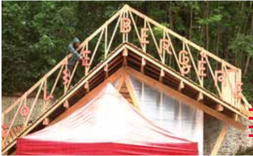
La bergerie du fort de Tourneville et le nouveau mobilier, Collectif Etc, Le Havre

À l'occasion des 500 ans du Fort de Tourneville au Havre, le Collectif Etc, accompagné de trois autres associations ont eu pour but d'affirmer la position du Fort en tant que lieu culturel tout en contribuant à la réappropriation du Fort par ses usagers mais aussi les habitants. On y trouve notamment