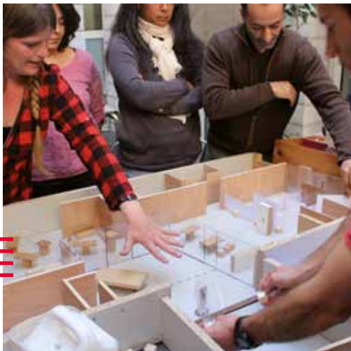
Réflexion autour d'un centre d'accueil Sleep'in, Pôle Éco-Design, Marseille (13)

Améliorer, enrichir, construire des modes d'appropriations du projet. L'intégration des usages est prise en compte et la participation et la créativité des usagers est sollicitée afin d'anticiper au maximum les éventuelles difficultés.