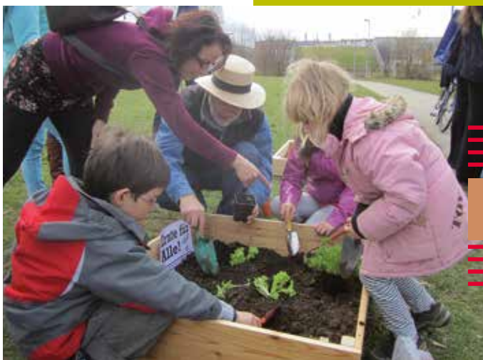
Les Incroyables comestibles, Fribourg, Allemagne

Observatoire, entretien, questionnaires informels ou organisés peuvent être réalisés. Ils permettent de mettre en place une consultation méthodique.