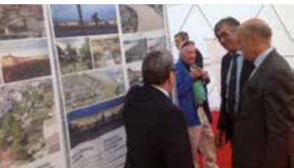
Exposition itinérante « Bordeaux 2030 », Bordeaux (33)