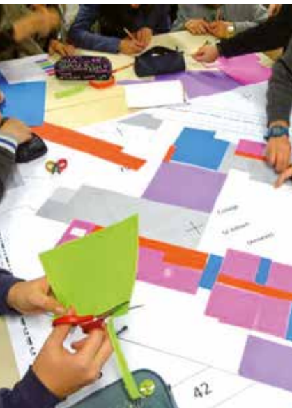
Atelier pédagogique au Collège Saint-Adrien, Villeneuve d'Ascq (59)