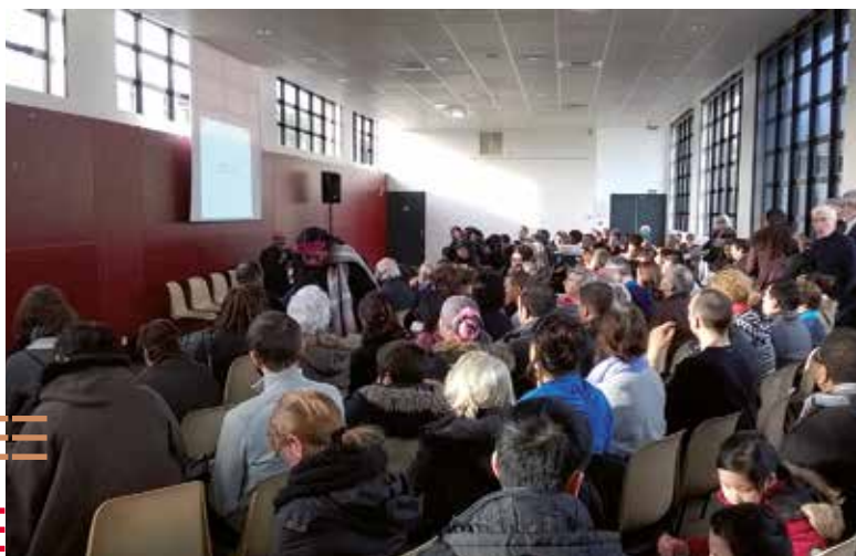
1- Diagnostic : réunion publique de quartier, Saint-Etienne (42)