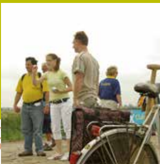
De retour en Ardèche, Les Robins des Villes, Pont d'Aubenas (07)

concertation participative citoyenne une production individuelle et collective au service du projet