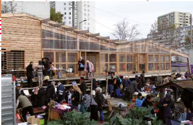
3- Gestion : agrocité, projet R-urban, atelier d'architecture autogéré, Gennevilliers (92)