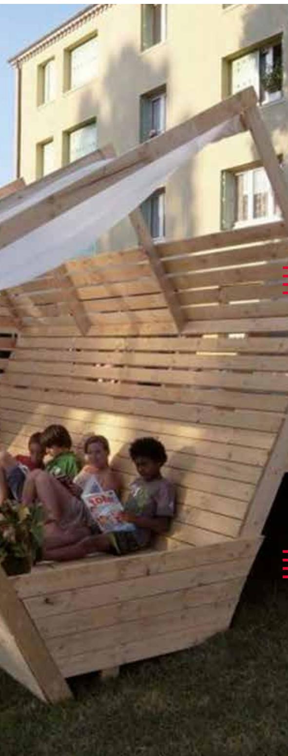
Mobilier réalisés par les habitants du quartier HLM, Collectif de l'aire, Saint-Jean-en-Royans (26)